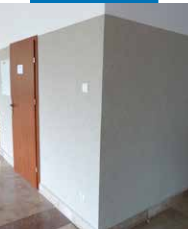
Przykład zastosowania Mape-Mosaic na ścianie ciągu komunikacyjnego