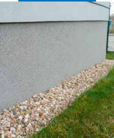
Przykład zastosowania Mape-Mosaic na zewnętrznej ścianie budynku